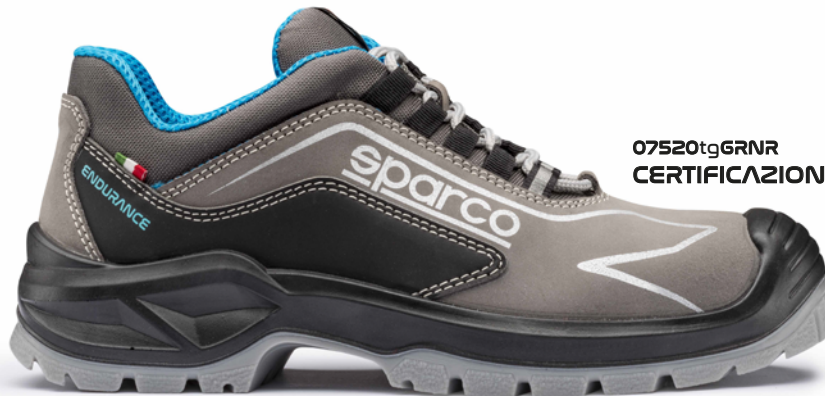
07520tgGRNR CERTIFICAZIONE S3