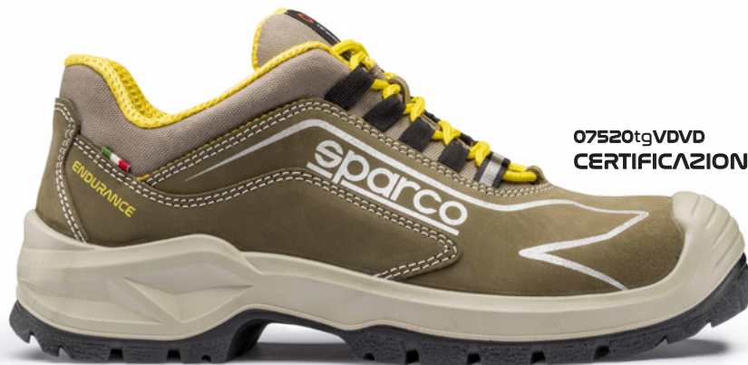
07520tgVDVD CERTIFICAZIONE S3