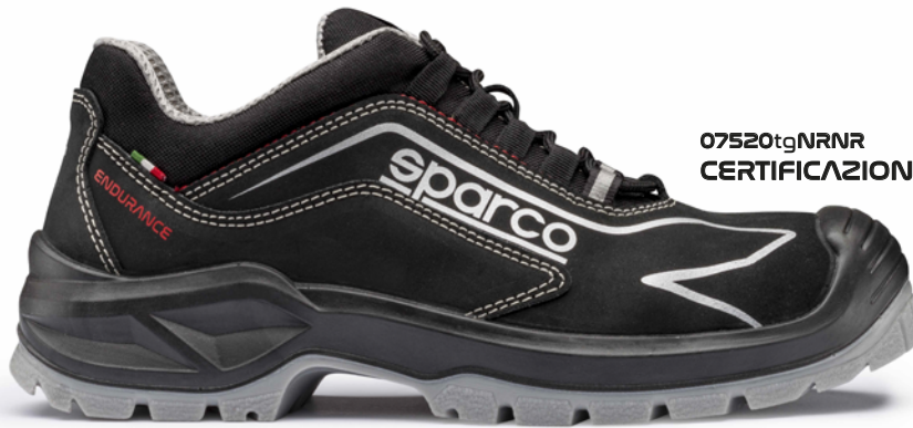
07520tgNRNR CERTIFICAZIONE S3